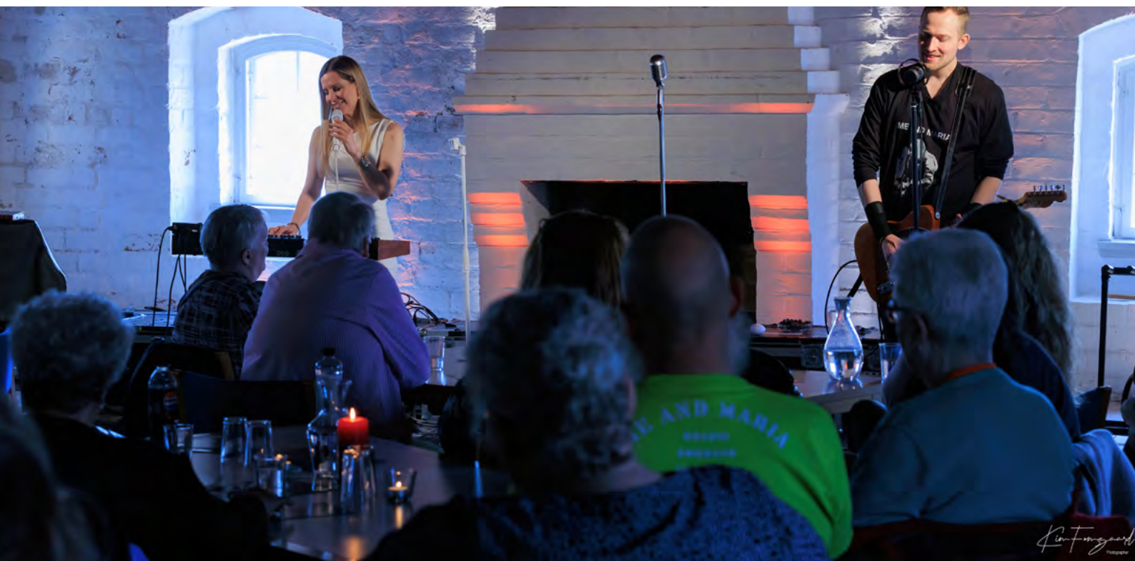
Fra Me and Maria koncert i det gamle Kompagnihus i Næstved.